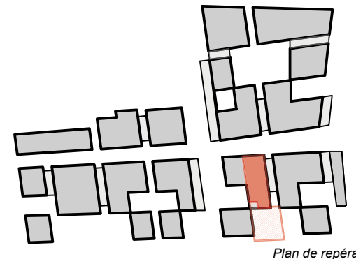
Plan de repérage

SNC Santé Bordeaux Valorisation atelier d'architecture King Kong